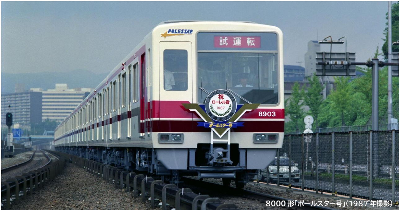
8000 形「ポールスター号」(1987 年撮影)

北大阪急行電鉄株式会社（本社：大阪府豊中市、社長：奥野雅弘）は、2026 年 7 月 1 日に営業開始 40 周年を迎える 8000 形「ポールスター号」の記念企画を 2026 年 4 月 22 日から実施いたします。