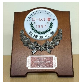
鉄道友の会ローレル賞 記念盾

現在、8000 形は 3 編成が運行しておりますが、8003 編成は 2027 年 1 月頃、残り 2 編成（8006・8007 編成）も順次運行を終了し、新造車に置き換えていく予定です。