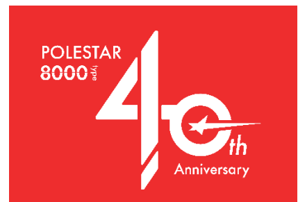
ワンポイントラッピング