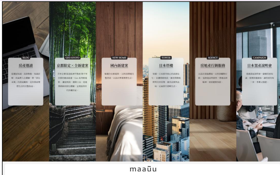
maaū (也有房産)社が提供しているホームページの画面

阪急阪神不動産株式会社は、台湾の不動産テックベンチャーの細細生活網路科技股份有限公司（本社：中華民国台北市、以下、「maaū（也有房産）社」と、業務提携契約を締結しましたので、お知らせします。この提携により、maaū（也有房産）社が提供する不動産販売プラットフォームを通じて、台湾のお客様に、当社が日本で取り扱う住宅の売買仲介サービスの提供を行ってまいります。