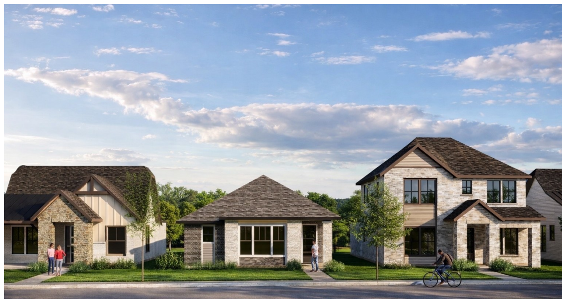
分譲戸建住宅（イメージパース）

阪急阪神不動産株式会社は、アメリカの不動産デベロッパー「Bridge Tower Homes」と協働し、テキサス州のダラス・フォートワース都市圏※における総戸数2,700戸超の大規模タウンシップ開発『(仮称)Meraki』の一部区画に参画することになりましたので、お知らせいたします。本タウンシップ開発の中では、複数のデベロッパーが戸建住宅分譲事業を手掛けており、当社は同開発において総戸数31戸の戸建住宅分譲事業（以下、本プロジェクト）に参画し、本年秋からの順次竣工を目指してまいります。なお、本プロジェクトは、当社のアメリカにおける戸建住宅分譲事業の第2号案件となります。