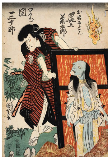
国芳画 二世関三十郎 天保2年(1831) ＜色悪＞伊右衛門