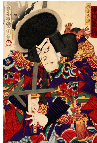
国周画 四世中村芝翫 明治16年(1883) ＜国崩し＞松永大膳