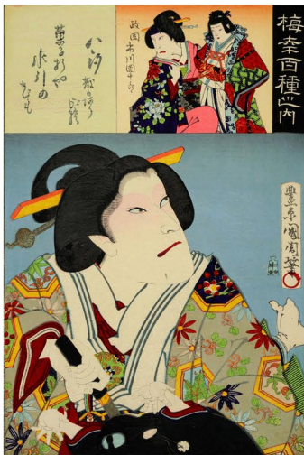
国周画 五世尾上菊五郎 明治26年(1893) ＜加役＞八汐