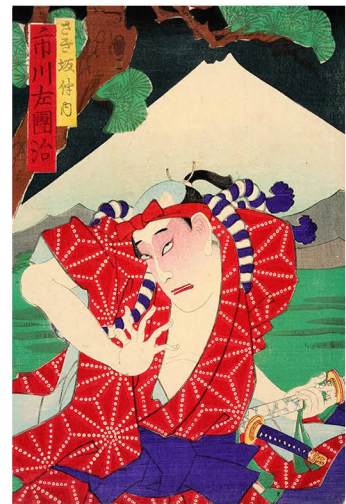
周重画 初世市川左團次 明治11年(1878) ＜ちゃり敵＞さぎ坂伴内