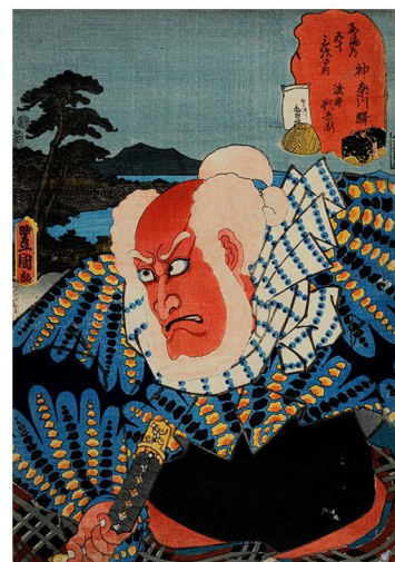
三世豊国画 五世市川海老蔵 嘉永5年(1852) ＜赤っ面＞渡守頓兵衛