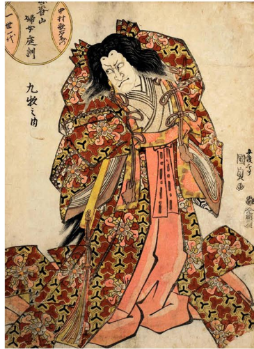
初世国貞画 三世中村歌右衛門 文化12年(1815) ＜公家悪＞曾我入鹿