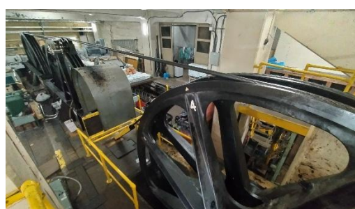
巻上場内の巻上装置（直径4mの大滑車）