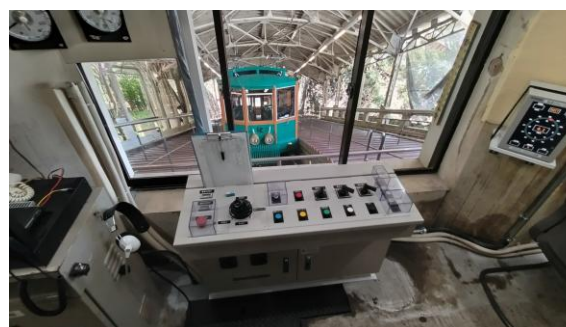
旧運転制御装置（運転台）