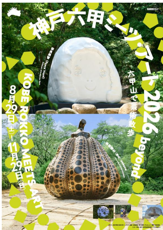
Artwork: ©Yoshitomo Nara, ©YAYOI KUSAMA 画像転載不可