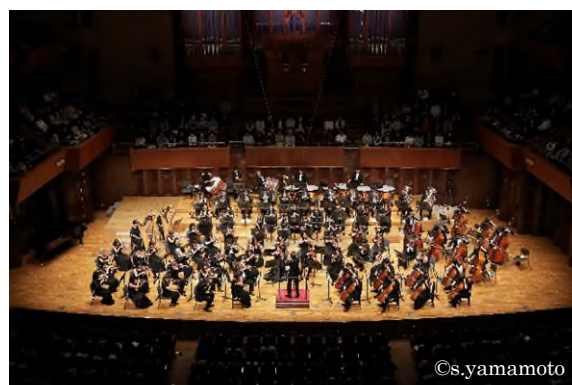
関西フィルハーモニー管弦楽団

阪急電鉄では、阪急阪神ホールディングスグループの社会貢献活動「阪急阪神 未来のゆめ・まちプロジェクト」の一環として、6月21日(日)に「阪急ゆめ・まち 親子チャリティコンサート」を開催します。