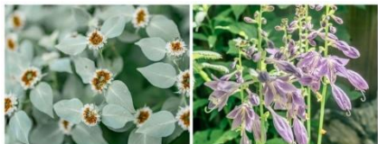
マウンテンミント (7月中旬～8月下旬) ギボウシ (7月中旬～8月中旬)