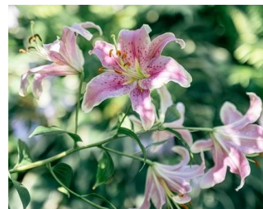
ユリ類(6月下旬～8月中旬)