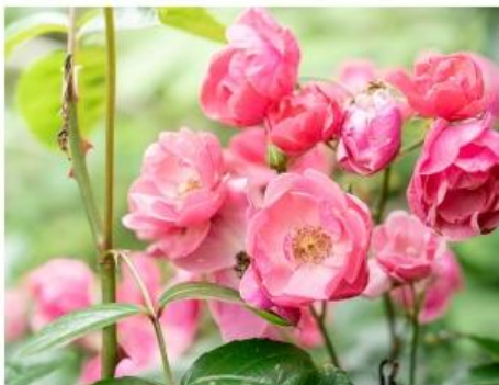
バラ類(6月中旬～7月中旬)