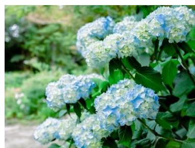
アジサイ類(6月下旬～8月中旬)