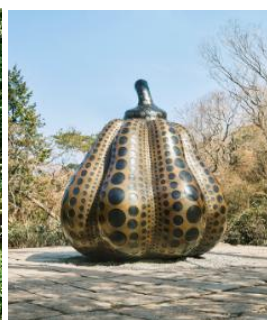
草間彌生《南瓜》 (2014年、特別寄託作品) ©YAYOI KUSAMA 画像転載不可