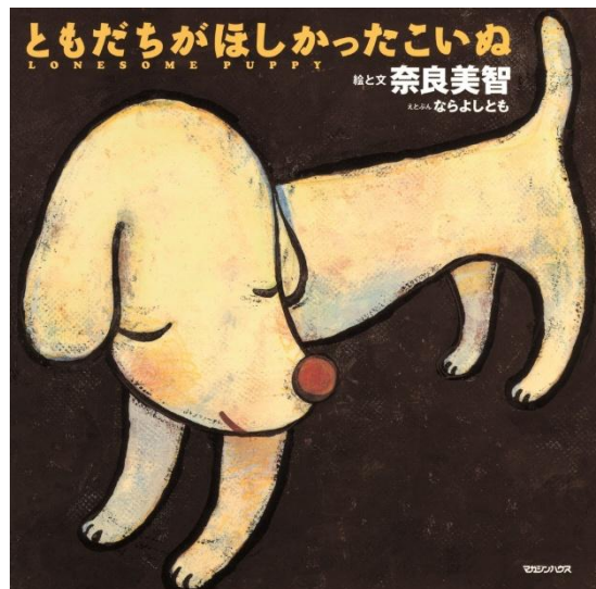
絵本『ともだちがほしかったこいぬ』(マガジンハウス)書影 Artwork: © Yoshitomo Nara

※神戸六甲ミーツ・アート2026 beyond期間の2026年8月29日(土)～11月29日(日)も10:20／12:20に約10分間上演。