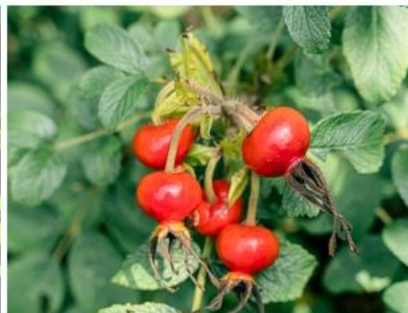
ハマナスの実(7月上旬～8月中旬)