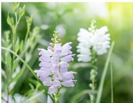
ハナトラノオ(7月上旬～8月中旬)