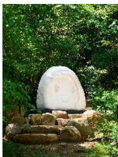
奈良美智《Peace Head》 Artwork © Yoshitomo Nara

【作 品】植田麻由《Daikon》、草間彌生《南瓜》(特別寄託作品)、さとうりさ《こはち》、さわひらき《shadow step》、高橋瑠璃《2人の秘密の間を過ごす》、奈良美智《Peace Head》、西田秀己《fragile distance A-A', B-B', C-C' (point A point B)》