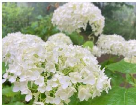
アナベル(7月上旬～8月中旬)