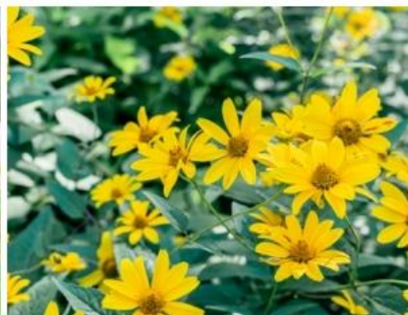
ヘリオプシス(7月中旬～8月上旬)

※天候により開花状況が変動する場合があります。最新の状況は SNS をご確認ください。 X @rokkomorinone Instagram @siki_garden