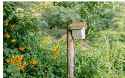
巣箱型オルゴール