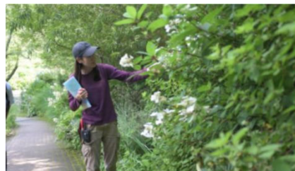
ガーデンツアーの様子(イメージ)