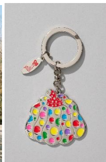
キーリング かぼちゃ ／マルチカラー 5,500円(税込) ©YAYOI KUSAMA