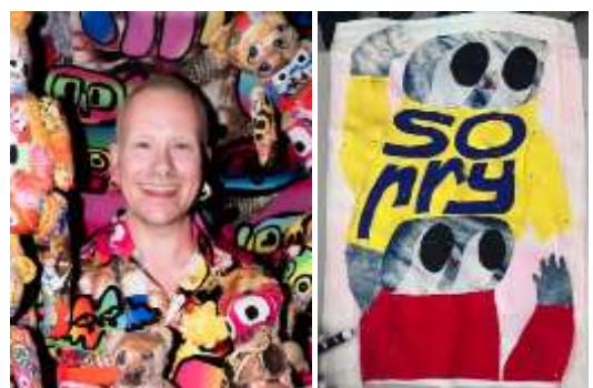
バス・コスターズ氏

オランダ・アムステルダムを拠点に活動するアーティスト／デザイナー。ファッションデザイナーとして注目を集めた後、テキスタイルを軸に、ドローイング、立体、陶芸へと表現を拡張。オランダのトゥウェンテ国立美術館で大規模回顧展を開催し、ヨーロッパを中心に、美術館、ギャラリー、アートフェアで活動中。