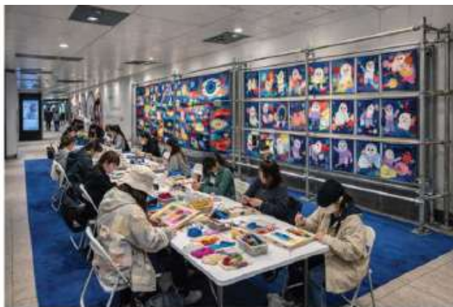
制作イメージ ※本画像は生成AIで作成した画像です