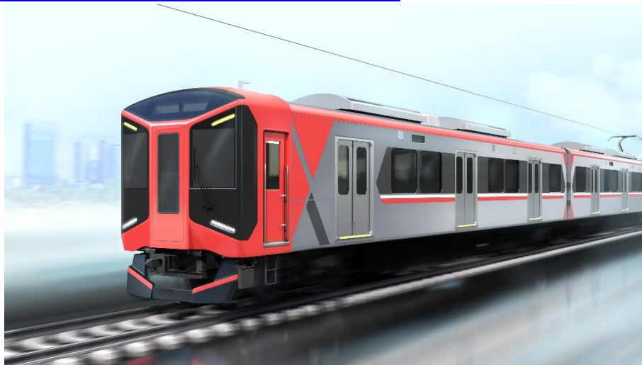
新型急行用車両3000系（イメージパース）

https://www.hanshin.co.jp/press/detail/004393.html