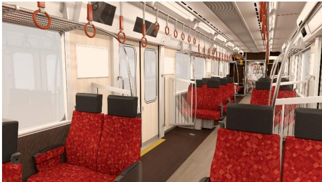
クロスシート転換時（イメージ）