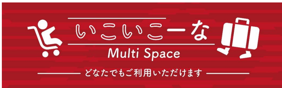
いこいこーな標記

座席指定サービス対象車両を除く各車両に、立ち続ける際の疲労を軽減することができるマルチスペース「いこいこーな」を設置します。