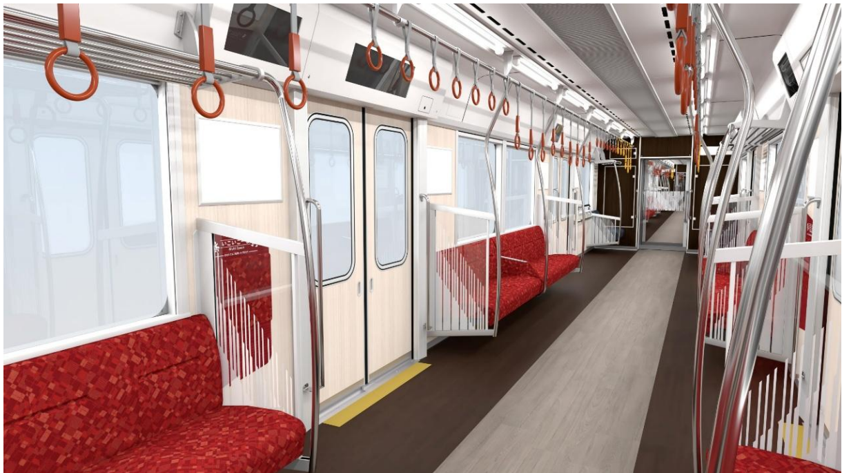
インテリアデザイン（イメージ）