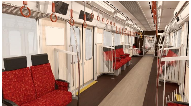
ロングシート転換時（イメージ）