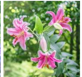
ユリ類 6月下旬～8月中旬