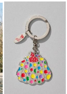
キーリング かぼちゃ ／マルチカラー 5,500円(税込) © YAYOI KUSAMA