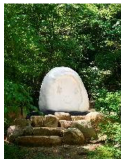
奈良美智《Peace Head》 Artwork © Yoshitomo Nara