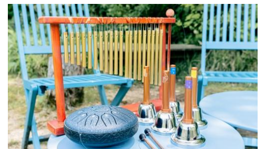
涼しい音を奏でよう(イメージ)