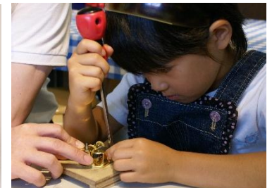
オルゴール組立体験の様子