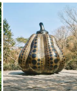
草間彌生《南瓜》 (2014年、特別寄託作品) © YAYOI KUSAMA 画像転載不可