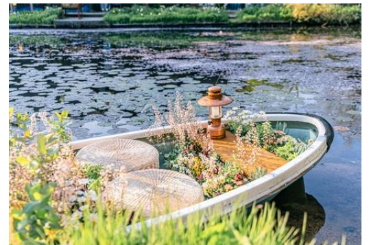
フォトスポット「フラワーボート」(イメージ)