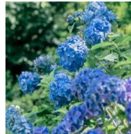
アジサイ類 6月下旬～8月中旬

【作 品】植田麻由《Daikon》、草間彌生《南瓜》(特別寄託作品)、さとうりさ《こはち》、さわひらき《shadow step》、高橋瑠璃《2人の秘密の間を過ごす》、奈良美智《Peace Head》、西田秀己《fragile distance A-A', B-B', C-C' (point A point B)》