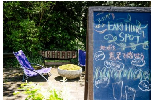
アーシング体験(イメージ)