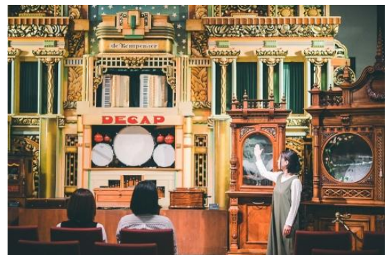
コンサートの様子(イメージ)