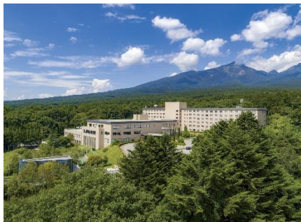
グランドメルキュール八ヶ岳

継続する物価上昇の影響で家計の消費マインドが低迷する中、阪急交通社では、JR各社 ※2 の協力のもと、夏旅を応援するタイムセールを実施します。消費に陰りが見られる一方で、ゴールデンウィークの旅行者数が前年を上回るなど、休暇期間に対する就業者層の旅行意欲は堅調に推移しています。特に、鉄道の旅は道路渋滞を回避できるため定時性が高く、夏の繁忙期でも時間効率よく休暇を楽しめます。