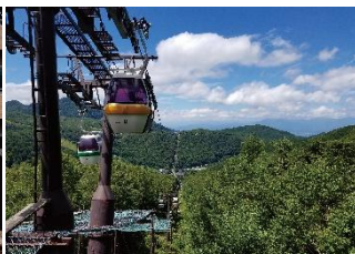
志賀高原ゴンドラ