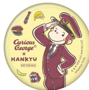
オリジナル缶バッジ