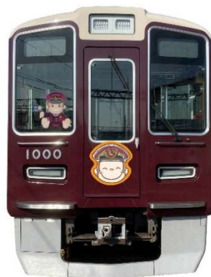
添乗イメージ（大阪梅田方）