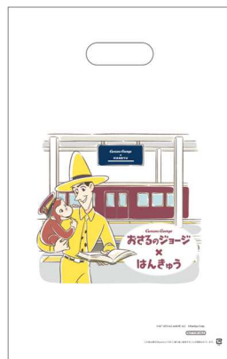
オリジナルショッパー

※2 オリジナル缶バッジは「ロフト」「Curious George Kitchen」でのプレゼントはありません。