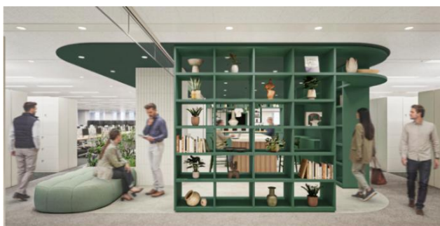
東京事務所(イメージ)