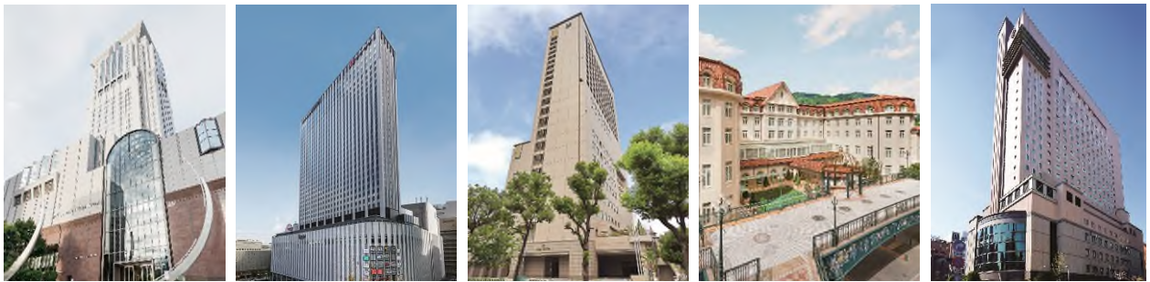
(画像左から)「ホテル阪急インターナショナル」「ホテル阪急レスパイア大阪」「ホテル阪神大阪」「宝塚ホテル」「第一ホテル東京」

【ホテルグルメ 特設サイト】 https://www.hankyu-hotel.com/group/campaign/curiousgeorge