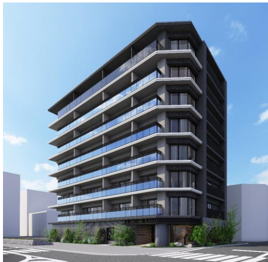
外観完成予想パース

本物件は大阪や京都へ直接アクセスできるほか、奈良県内の各方面をつなぐターミナル駅・近鉄「大和西大寺駅」から徒歩で約3分と、交通利便性に優れた立地が魅力です。電気とガスを効率的に利用可能なハイブリッド給湯機を関西圏の新築分譲マンションとして初めて導入 *1 するなど、高い環境性能を有するGX ZEH 基準に対応したマンションとして、2028年2月の完成を目指します。