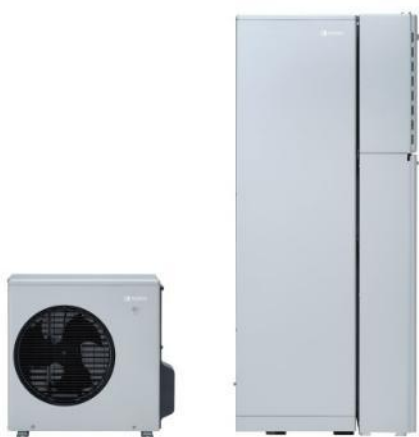
コンパクトな貯湯タンクを備えた マンションにも設置可能なハイブリッド給湯機「HP HB R290」

給湯設備は、家庭で消費される一次エネルギー消費量の約3割を占めると言われています。本物件では、関西電力からのエネルギーソリューション提案を踏まえて、給湯分野における省エネルギーを図る設備としてハイブリッド給湯機を採用します。本設備は空気熱を活用した「電気」のヒートポンプと、「ガス」の高効率給湯器を組み合わせた給湯・暖房システムです。ヒートポンプの高い省エネ性能を活かしながら、必要な時にガス給湯器が補助することで、少ないエネルギーでお湯をつくることができ、環境負荷の低減に貢献します。今回採用したノーリツ製の自然冷媒ハイブリッド給湯機「HPHB R290」（70L MODEL）は、同社従来のガス給湯器と比べてCO 2 排出量を約55%、給湯・保温における一次エネルギー消費量を約44%削減し、環境性と省エネ性を両立させました。