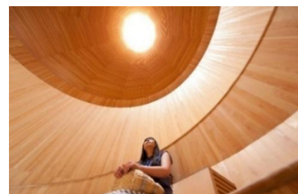
「風室」の天井部分から空気が排出される。