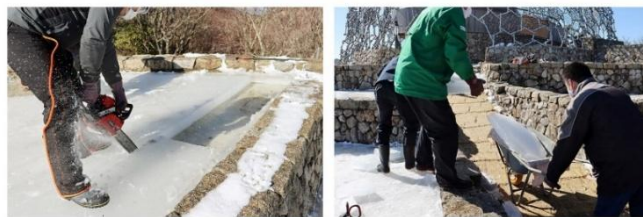
①「氷棚」にできた氷を切り出し、運び出します。