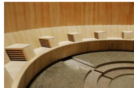
椅子のヒジ置き部分から冷風が取り込まれる。