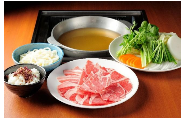
50年目の挑戦！ シェフこだわりのダシで食べるヘルシーラムしゃぶ ダシが決め手！ラムしゃぶ 3,900円(税込)