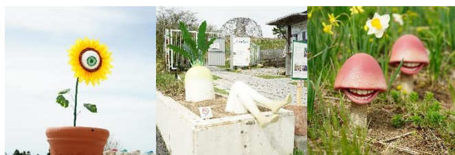
現在開催中の「きみよい植物展」の様子