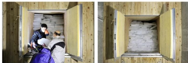
②展望台内部にある「氷室」に運び、夏まで氷を貯蔵します。

毎年、六甲枝垂れの開業日である7月13日になると、氷を貯蔵した「氷室」の扉を開放し、六甲山上に吹く風を取り込む「氷室開き」を行います。氷室を通った風は冷気となり、展望台内部の「風室(ふうしつ)」にある椅子のヒジ置き部分から風室内へ取り込まれます。風室内は神戸市街地と比べて約10度気温が低く、ひんやりと心地良い空間が広がります。この電力を一切使用せずに、自然の力だけで涼が楽しめる体験が「冷風体験」です。