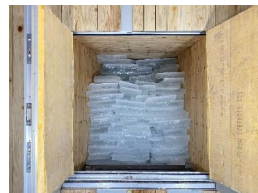
1月26日(月)に 氷を貯蔵した氷室の様子

【備考】 普段は非公開の氷室内部を見学できる、年に1度だけの貴重な機会です。また見学会後、六甲枝垂れで開催中のイベント「きみよい植物展」も無料でご鑑賞いただけます。ぜひお越しください。