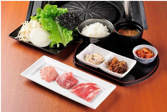
当店人気のラム肉3種がお得な価格で楽しめる！ 祝！50周年ラムランチ 1,976円(税込) ※ランチタイムのみ注文可能。14時LO。