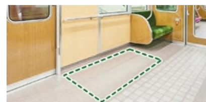
車椅子スペースの拡大

なお、2020年度からは、視覚に障がいのあるお客様に車両の乗降口の位置をお知らせするため、扉が開いている間、誘導音が鳴動する機能を順次導入しています。