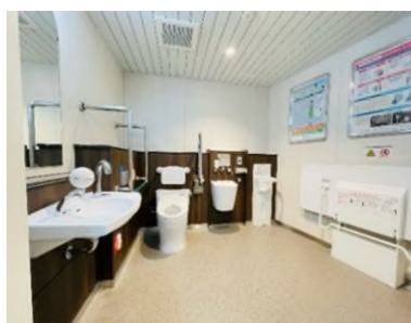
バリアフリートイレ（淡路駅）