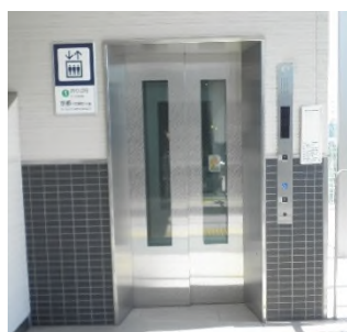
エレベーター（洛西口駅）