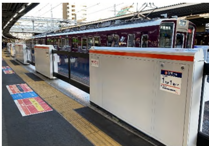
可動式ホーム柵（十三駅3号線ホーム）