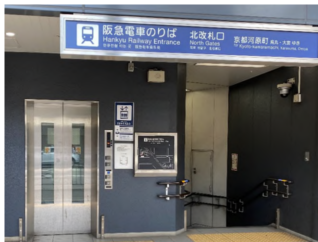
エレベーター（西院駅）