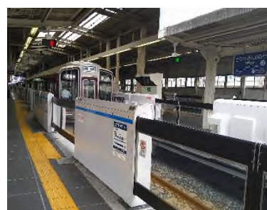
可動式ホーム柵（神戸三宮駅）