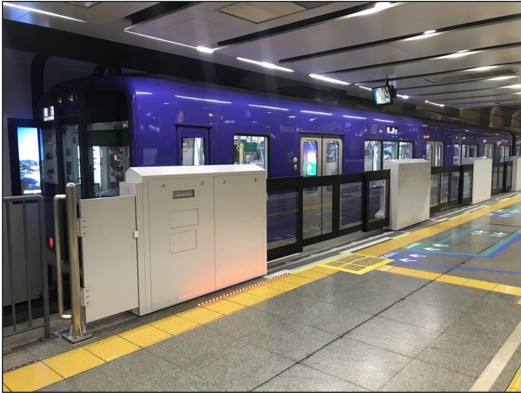
< 1番線・3番線ホームの可動式ホーム柵 >

(注) 2番線ホーム(2022年春頃完成予定)は、昇降ロープ式ホーム柵を設置します。