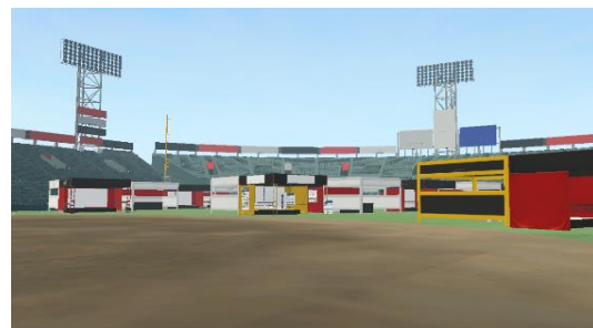
デジタル甲子園のイメージ