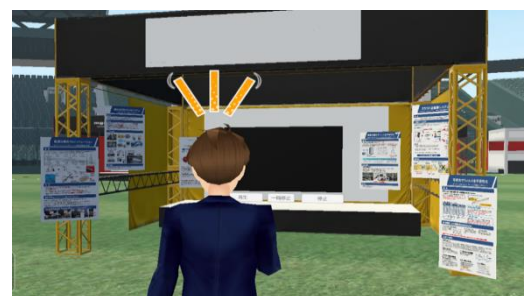
来場者アバターの目線のイメージ