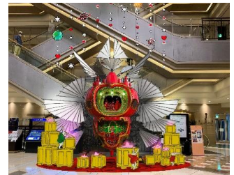
▶ハービスPLAZA 1F オルガン広場

ルーシー博士たちは無事地球へと戻ってきました。この旅がとても過酷で危険だったことを物語るようにスペースシップはダメージを受けています。