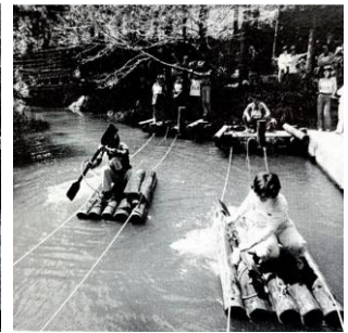
※六甲山フィールド・アスレチックの過去の写真