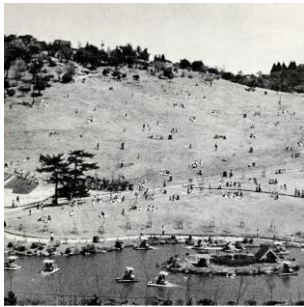
※六甲山カンツリーハウスの過去の写真

六甲山カンツリーハウスは1937年6月30日に山上滞在者のレクリエーションのためにバンガロー風の建物とゴルフ場9ホール、テニスコート2面、魚釣り池等を配した施設として開業して以来、六甲山の自然の中でアウトドアスポーツやバーベキュー、遊具、季節の植物を楽しむことができる遊び場として83年間営業を続けて参りました。2019年には樹上2～15mの高さで体験する新アスレチック「フォレストアドベンチャー・神戸六甲山」をオープンし、多くのお客様にご利用いただきました。また、隣接する六甲山フィールド・アスレチックは1978年の開業以来、自然を活かした40ポイントの木製アスレチックが魅力の施設として営業して参りました。本計画では、「山、空、水辺。すべてが舞台の冒険王国。」をテーマに、水上・陸上にアスレチックを合計80ポイント新設し、日本最大級のアスレチックが楽しめる施設へと生まれ変わります。また、ジップスライド等種類の豊富なアスレチックを用意することで、小さなお子様だけではなく、大人の方まで幅広い世代の方が、体力や年齢にあわせて何度来ても楽しめる施設となるように努めて参ります。