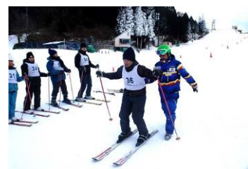
外国人向けスキースクールの様子