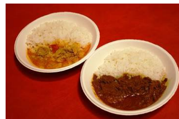
「ハラールフード」メニュー