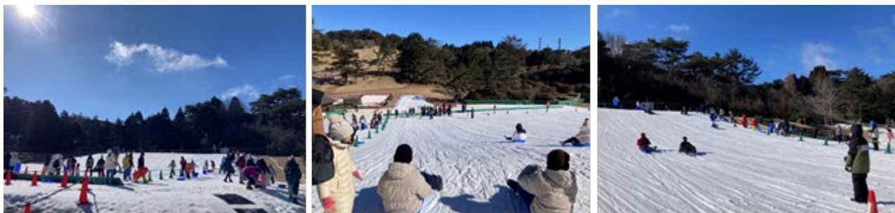
外国人団体 雪ゾリ・雪あそびゲレンデ「スノーランド」利用時の様子(2024年度)

春節シーズンが本格化する1月25日(土)～2月2日(日)の9日間には、147件、約3,850名*が来園する予定です。*1月21日(火)時点の予約ベースの人数。