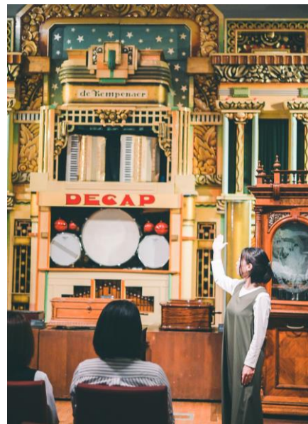
コンサートルームの様子

【時 間】 10:00～17:00 ※コンサートルーム内の見学は16:30まで。