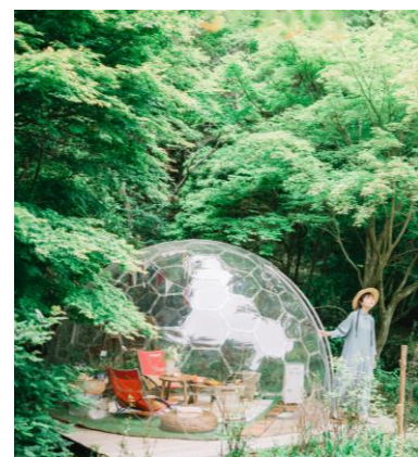
初夏の SIKI ドーム