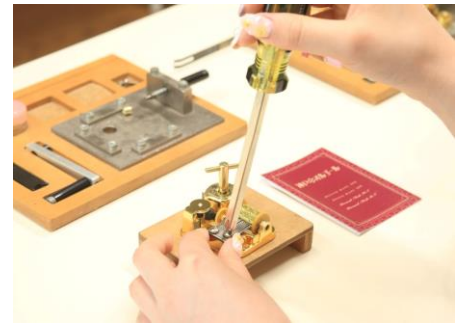
オルゴール組立体験(上級コースイメージ)