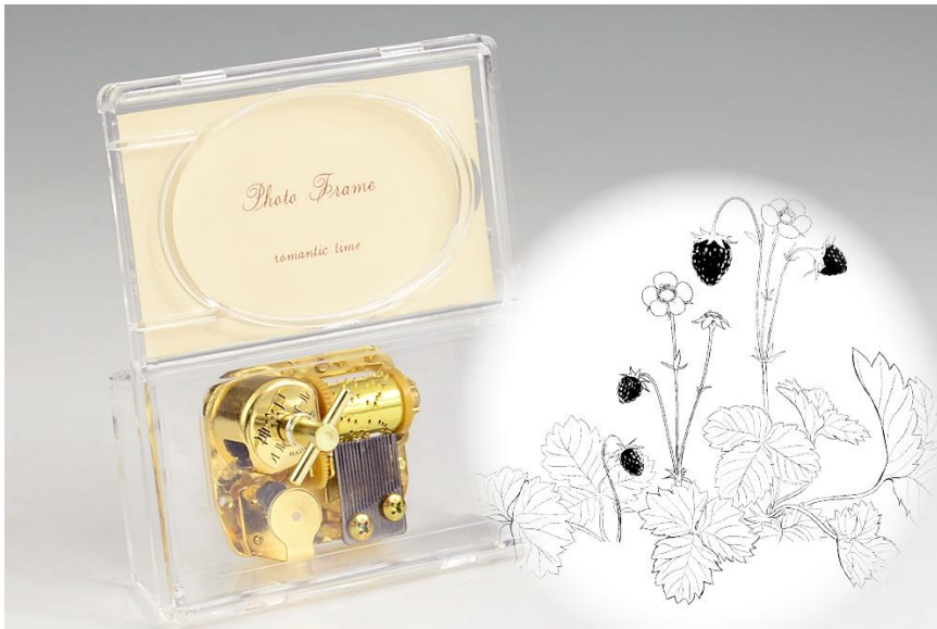
神戸オルゴール 18N プラフォトフレームとボタニカルフェア限定オリジナルデザインイメージ