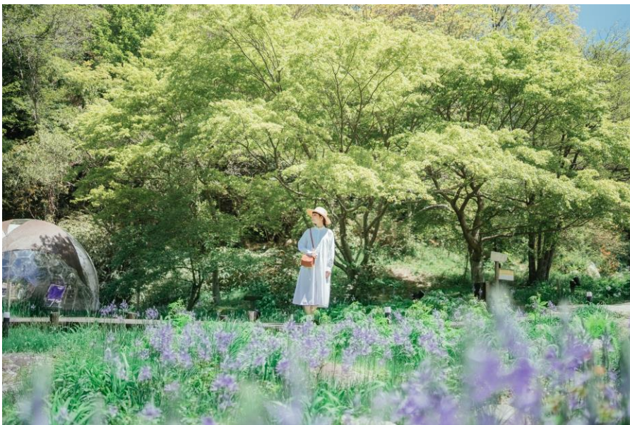
SIKI ガーデン内、「せせらぎのメドウ」のカマシア(2023年5月撮影)

六甲山観光株式会社(本社: 神戸市 社長: 寺西公彦)が運営する、ROKKO森の音ミュージアムでは、2024年3月16日(土)～6月30日(日)に、「30th Anniversary 森の音ボタニカルフェア」を開催します。