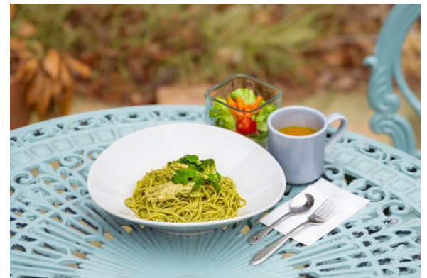
チキンとブロッコリーのジェノベーゼスパゲティ (イメージ)

バジルペーストにオリーブオイル、パルメザンチーズ、唐辛子で仕上げたジェノベーゼソースを使った風味豊かなスパゲティです。国産鶏むね肉を使用した蒸し鶏ともよく合います。