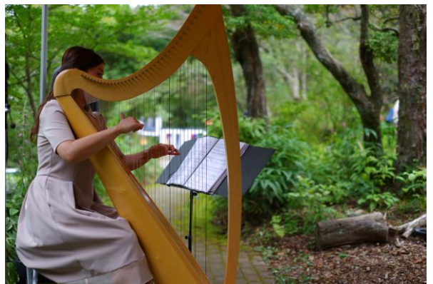
SIKIガーデンコンサート 過去の様子