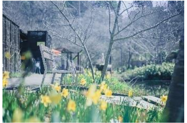
4月～5月頃の SIKI ガーデン (2023年撮影)