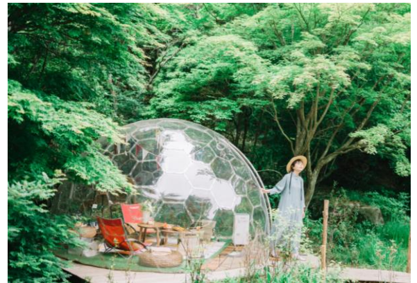
初夏の SIKIドーム