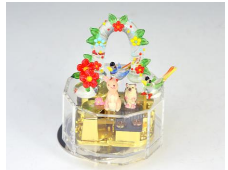
オルゴール デコレーションイメージ