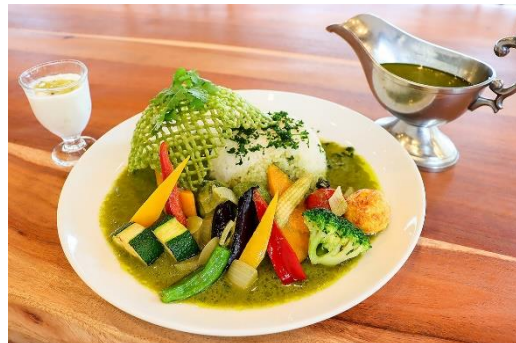
六甲枝垂れグリーンカレー 1,500円 (提供店舗：六甲ビューパレス)