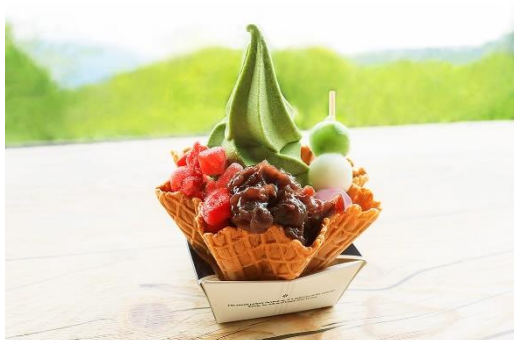
抹茶ソフトの和パフェ 650円