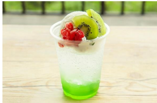
六甲山”ミドリ”キウイソーダフロート 650円 (提供店舗：うりぼうキッチンカー)