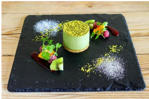
ピスタチオムース 900円 (提供店舗：グラニットカフェ)

イベント限定の「ミドリのメニュー」を六甲ガーデンテラス内の飲食店舗、うりぼうキッチンカーで提供しています。飲食店舗では、神戸・大阪の眺望が楽しめる座席をご用意しております。