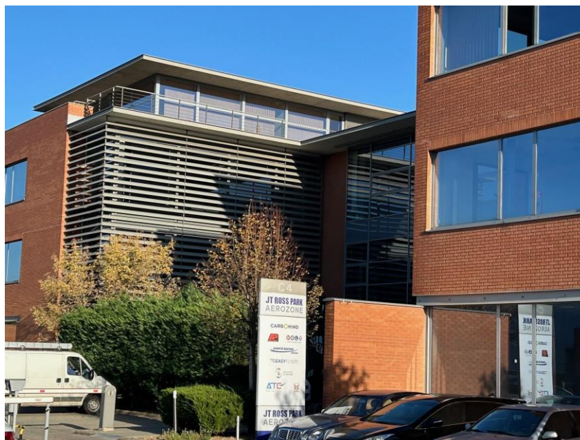
JT Ross Park Aerozone