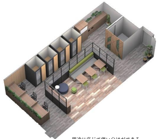
用途に応じて使い分けができる コワーキングスペース（イメージ図）