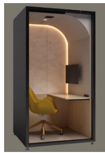
ワークブース（参考イメージ図）

リモートワークやWeb会議に集中できる個室のワークブースを取り入れたコワーキングスペース（彩都スタイルクラブ提携共用施設）が活用可能です。マンション内の自宅とは異なるスペースでのリモートワークは、オン・オフの切り替えにも最適です。また本物件内には、お住まいの方同士のつながりやコミュニティ形成に役立つラウンジやパーティールーム、キッズルームも設けています。