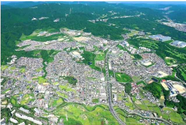
茨木市と箕面市にまたがる国際文化公園都市「彩都」

また地元農家と彩都住民が協働して米づくりを行う「彩都棚田ファーマークラブ」を運営し、住民の自然環境を守る意識の向上を図るとともに、子どもたちの食育を推進しています。