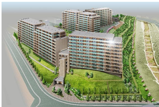
「ジオ彩都いろどりの丘」完成予想図

ニューノーマルに対応した住戸プランや共用施設も用意し、彩都での新たな暮らしを提案します。