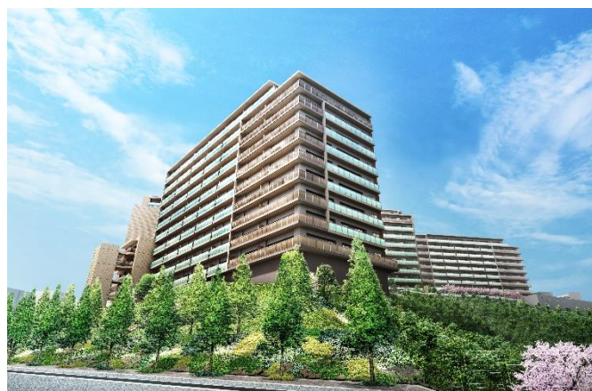
「ジオ彩都いろどりの丘」完成予想図

「ジオ彩都いろどりの丘」は、大阪モノレール「彩都西」駅より徒歩8分。住居専有面積：全邸75㎡以上のゆとりある住戸プランと、ニューノーマル対応をはじめとする充実の共用施設を有しています。本物件は〈ジオ〉シリーズにおいて第一号、箕面市内においても初登場 (※1) の高層ZEHマンションとなります。今後、2030年度までに当社が開発する全ての分譲マンションにおいて「ZEH-M Oriented」の実現します。