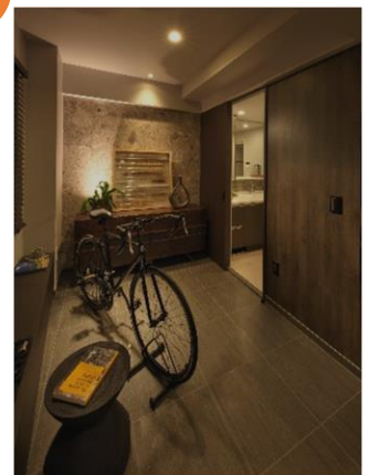
A type モデルルーム撮影