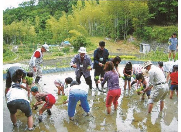
「彩都棚田ファーマークラブ」の田植え体験