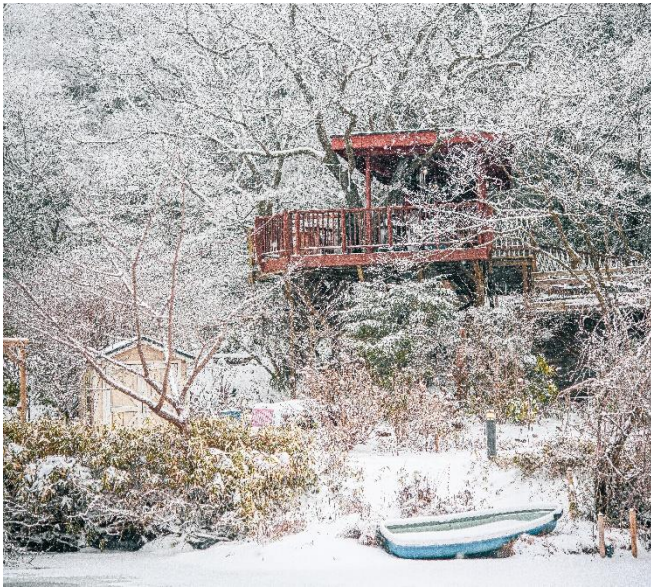
雪の日のツリーハウス