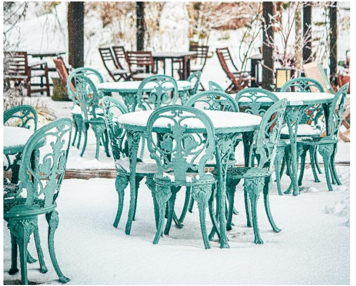
雪の日の森の Café テラス席

雪景色の日の土日祝限定でスタッフと共にSIKIガーデンを巡ります。ガーデン内のお薦めポイントや冬のガーデンの魅力をご紹介します。