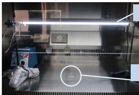
アイセーブ抗菌 CCFL ライト(直管型)