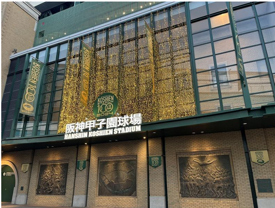
球場正面装飾（試験点灯時の様子）

1月4日に球場正面（7・8号門付近）の外周装飾が完成、夕刻にイルミネーションが点灯します。100周年イヤーである2024年の末（日付未定）まで、毎日点灯する予定です。正面装飾以外にも、3月に開催されるオープン戦までに甲子園駅前広場（西口前）に設置しているゲートや、正面ご入場後のエントランス部分等での装飾を施します。