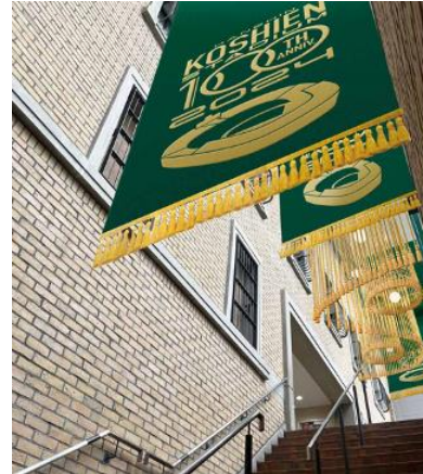
7・8号門エントランス装飾イメージ図