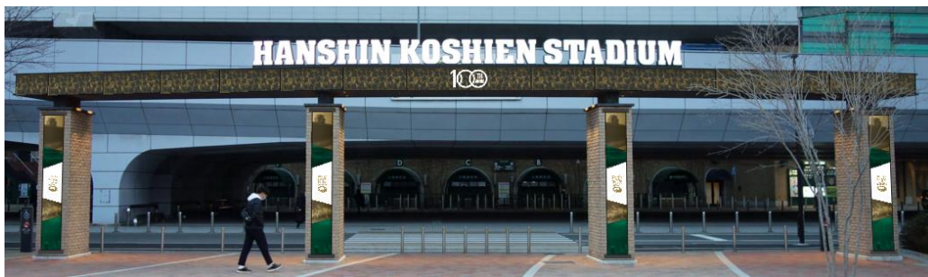
甲子園駅前広場ゲート装飾イメージ図