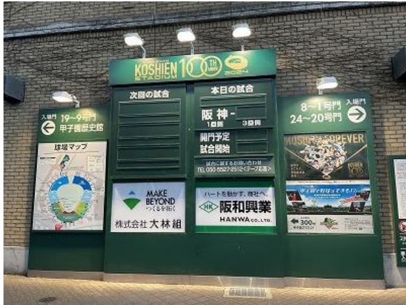
対戦看板での装飾 (23年末装飾済)