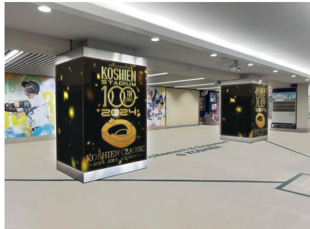
ウェルカムサイネージイメージ図