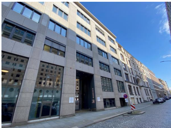
ABC WORK SPACE