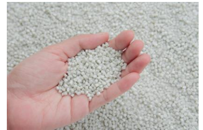
※装飾素材イメージ