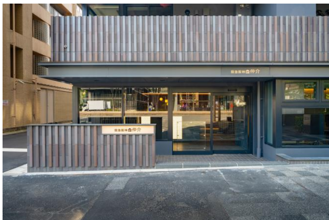
「ジオ京都御池通」と連続性を持たせたデザインの外装

当社では京都市中京区と上京区を中心に、〈ジオ〉シリーズのマンションを多数分譲してまいりました。このたび、京都市営地下鉄東西線「京都市役所前駅」（徒歩約1分）から好アクセスな立地を誇る新築分譲マンション「ジオ京都御池通」（2025年1月に竣工）の1階に「京都御池営業所」を新たにオープンいたします。本営業所は、京都市役所にも至近で、わかりやすく利便性の高い立地にて、居住用の不動産のみならず、投資用・事業用不動産など様々な不動産に関するご相談にお応えすることが出来ます。なお、新築分譲マンション内への営業所の開設は初めてとなります。