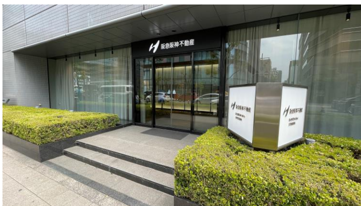
四つ橋筋に面した入口

※5/11～6/10の期間、家具メーカーの柏木工株式会社の家具を展示する予定です。