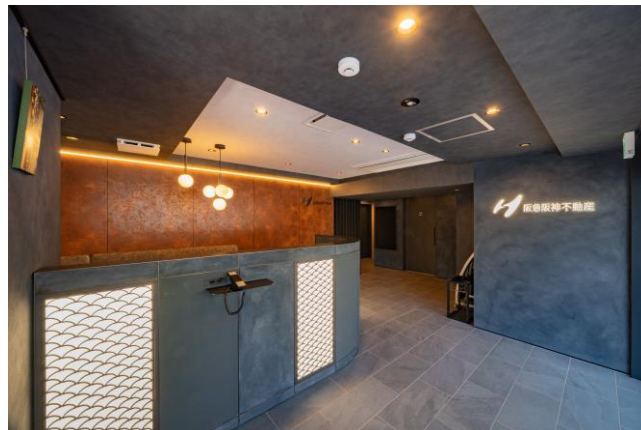
京都らしさにこだわったエントランス