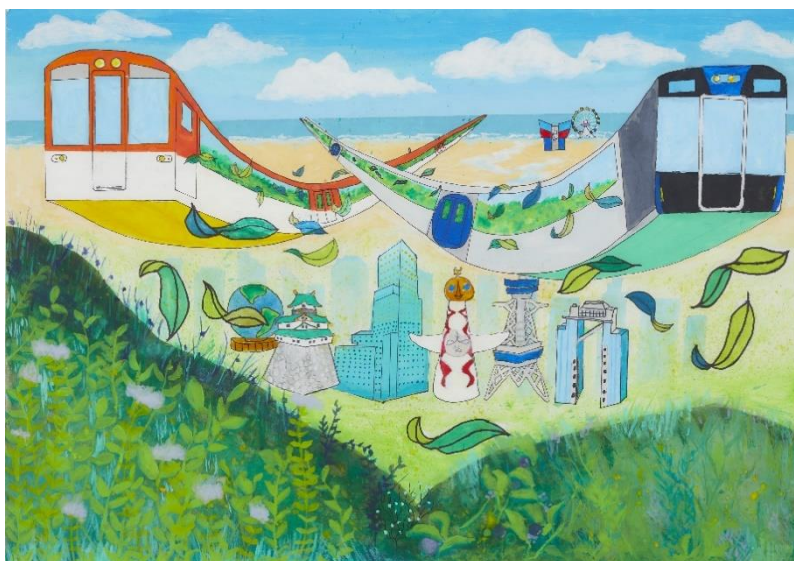
【昨年度の大賞作品】

絵画コンクール「ぼくとわたしの阪神電車 & 【120周年企画】オリジナルヘッドマーク」の詳細は、次ページ以降のとおりです。