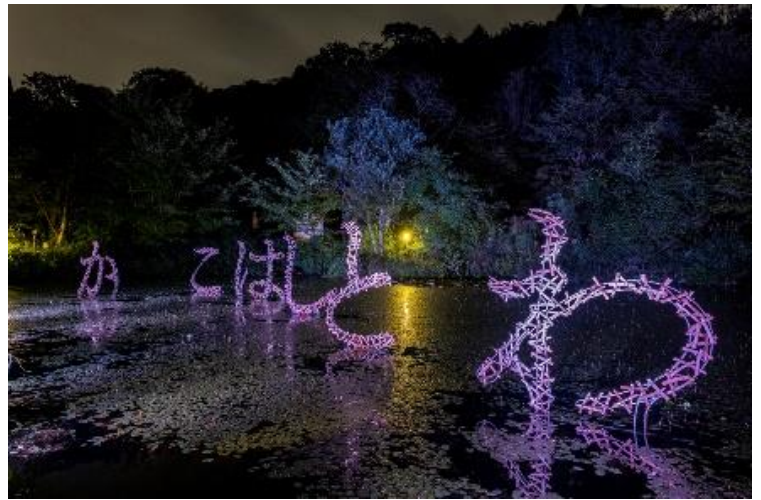
伏見雅之「過去とはどこか」2020年 六甲オルゴールミュージアム

下記期間中、ムットーニの作品上演に加え、「六甲ミーツ・アート 芸術散歩 2020」の野外アート作品をライトアップします。期間限定で夜間のみ鑑賞できる作品の展示も行います。1000万ドルの夜景が楽しめる時間帯にアート作品が鑑賞できます。