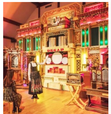
ミュージアムコンサート(イメージ)

【演奏楽器例】 ・ポリフォン54型「ミカド」(ディスク・オルゴール/1900年頃/ドイツ製) ・ロッホマン・オリジナル172型(ディスク・オルゴール/1904年頃/ドイツ製)