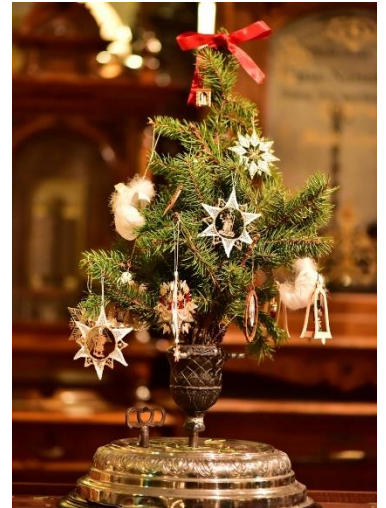
クリスマス・ツリー立て

【演奏曲目例】 ・ジングルベル(ジェームズ・ロード・ピアポント作曲) ・オー・ホーリー・ナイト(アドルフ・アダン作曲)