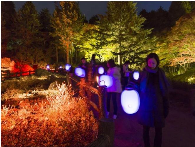
高橋匡太「Glow with Night Garden Project in Rokko 提灯行列ランドスケープ」2019年 六甲高山植物園