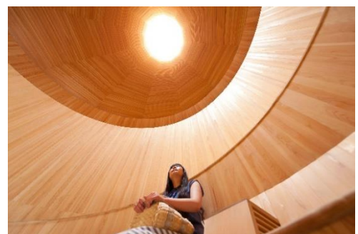
「風室」の天井部分から空気が排出される。