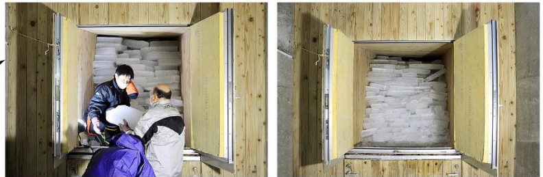
②展望台内部にある「氷室」に運び、夏まで氷を貯蔵します。