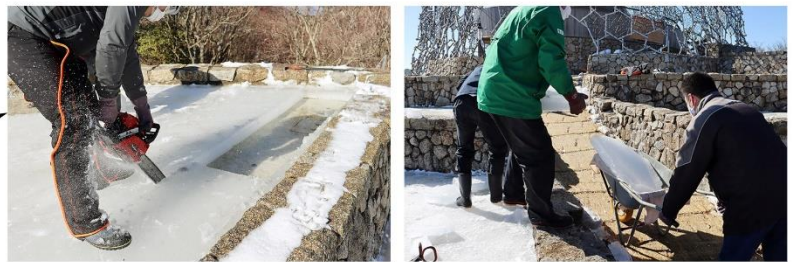
①「氷棚」にできた天然の氷を切り出し、運び出します。

夏になると氷を貯蔵した「氷室」へ六甲山上に吹く風を取り込み、展望台内部の「風室(ふうしつ)」に循環させ、電力を一切使用せずに自然の力だけで涼を楽しめる「冷風体験」を実施いたします。「氷室」を通った冷たい風は「風室」にある椅子のヒジ置き部分から室内へ取り込まれます。真夏でも風室内は20℃程度に保たれ、ヒノキの香りと共にひんやりと心地良い空間が広がります。