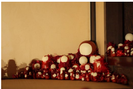
《試作 真っ赤童(まっかわらし)の部屋》2023年、 ikuno art stay 2023 non ribbon art(兵庫)