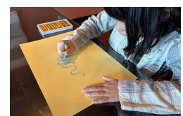
こどもプログラム

ワークショップ等を通じて自然の中で子どもたちが現代アートに触れられる機会を増やし、次世代の文化芸術の担い手や支え手を育てていきます。