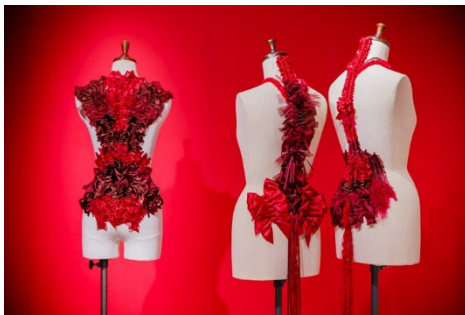
《背中、ちょうちょの巣》2023年、 のん Ribbon 展 怪しくて、可愛いもの。(仙台)