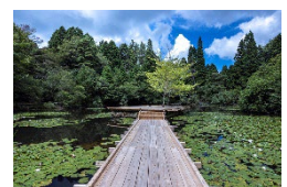
川俣正《六甲の浮き橋とテラス》

過去最多となる招待・公募を合わせた60組以上のアーティストの参加を予定しています。国内外から幅広い視点で活動しているアーティストの作品をご紹介します。また、公募作品の募集条件を向上し、より優れた作品を募集・展示します。