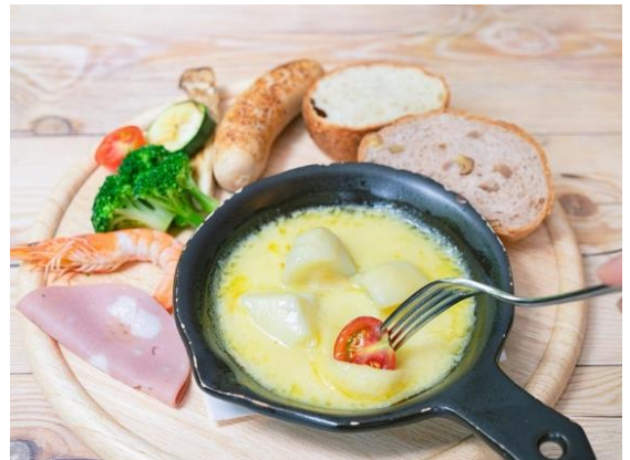
ラクレットチーズプレート

チーズを食材にかけて食べるスイスの郷土料理。ドイツではクリスマスマーケットやホームパーティなど特別な時に食べられる人気のグルメです。