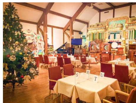
会場の様子(2022年撮影)