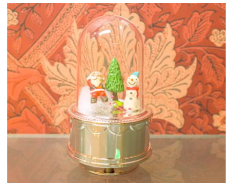
オルゴール・クリスマス・デコレーション(イメージ)