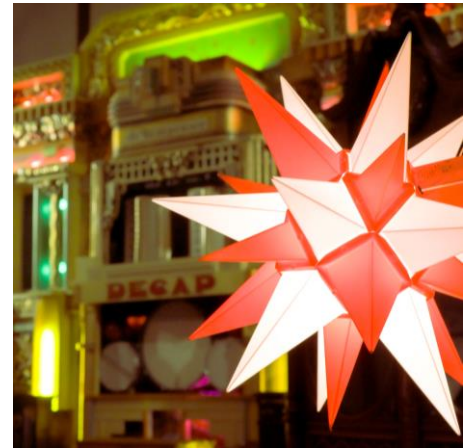
ヘルンフートの星