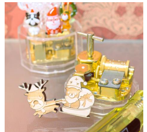
オルゴール組立体験(イメージ)