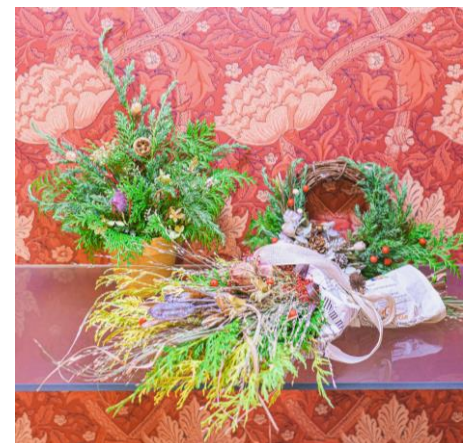
クリスマス飾りづくり(イメージ)