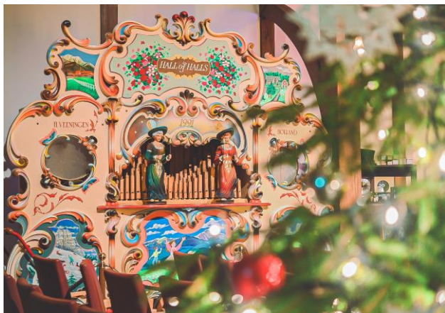
コンサートルームの様子