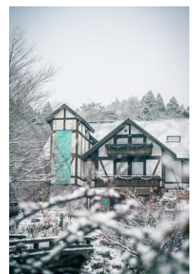
冬の森の音ホール(雪の日)