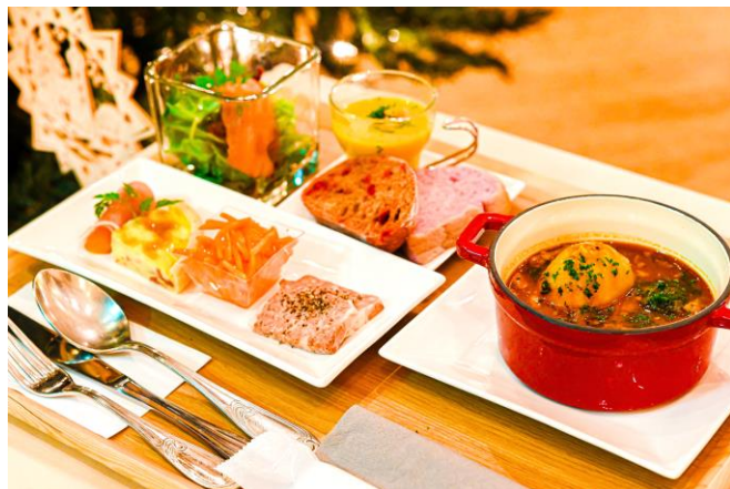
クリスマスディナー(2022年のメニュー、一部)

下記の日程で、夜のクリスマスイベントとして「森の音クリスマス・ナイト・コンサート」を開催します。当施設ならではの自動演奏楽器によるクリスマスコンサートが、併設の「森のCafé」特製クリスマスディナーと共に楽しめます。