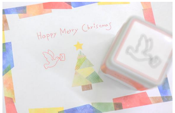
クリスマス・スタンプラリー「サンタをさがせ！」(イメージ)