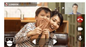
ビデオチャットロボット遠隔操作イメージ

また、新型コロナウイルスにより制限が設けられ面会が難しくなった高齢者施設に入所されているご高齢のご家族の面会や、お一人でお住まいのご家族と、離れている場所でも一緒にお食事や会話を楽しむことが可能です。