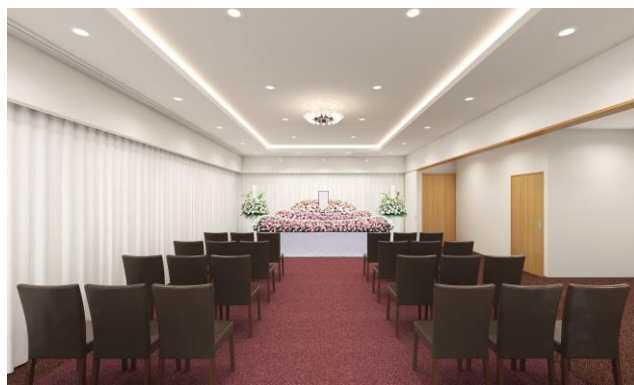
エテルノ鳴尾武庫川 式場イメージ