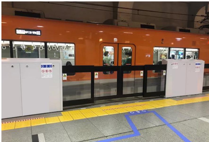
参考：ホームドア（大開口（二重引き戸）型）