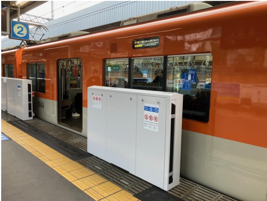
尼崎駅2番線ホームドア