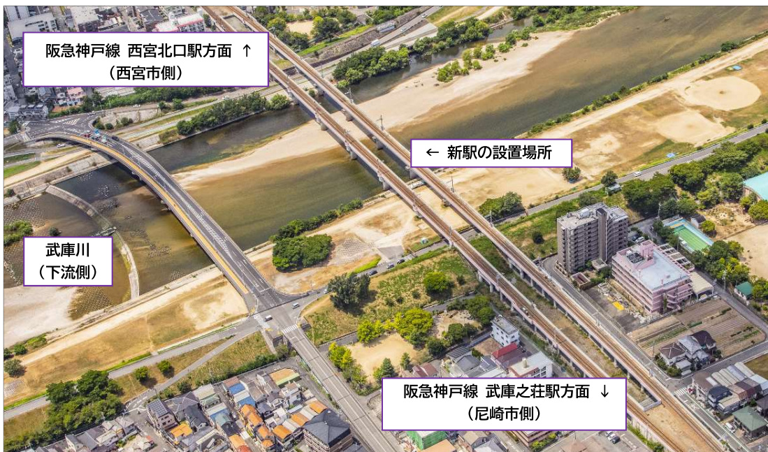
阪急神戸線（武庫之荘駅～西宮北口駅間）新駅設置場所となる武庫川橋梁付近（2024年7月撮影）

今般、本事業の概要や施行者、整備費及び費用負担等事業全体に関する基本協定書を締結し、2031年度末を開業目標として新駅設置事業に着手いたしましたので、お知らせいたします。