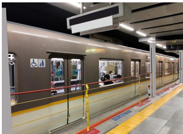
< 2番線ホーム：昇降ロープ式ホーム柵の設置イメージ（近鉄車両停車時） >