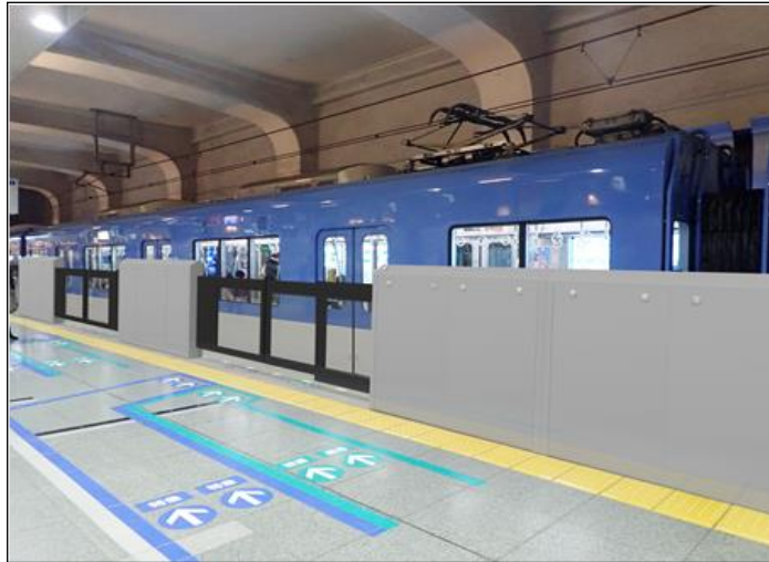
< 1番線・3番線ホーム：引き戸型ホーム柵の設置イメージ >