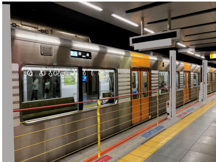
< 2番線ホーム：昇降ロープ式ホーム柵の設置イメージ（阪神車両停車時） >