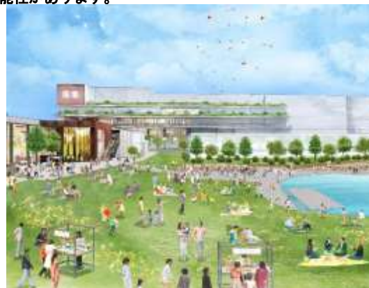
(千里阪急ホテル敷地周辺) 大規模商業施設と賑わい広場