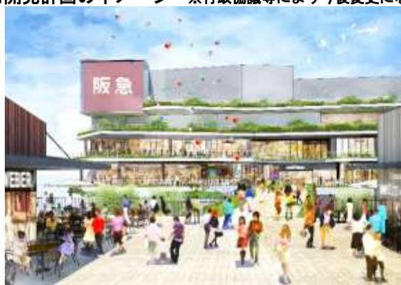
大規模商業施設の外観