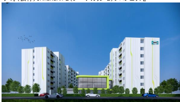
タイ『(仮称)Srinakarin 2(シーナカリン 2)プロジェクト』