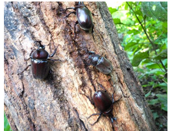
SIKI ガーデンのカブトムシ