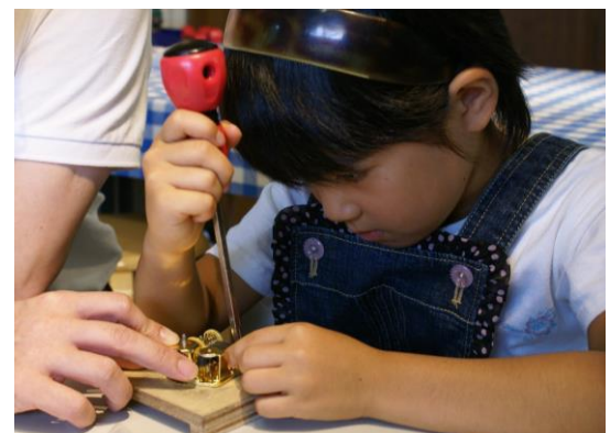
オルゴール組立体験の様子

※天災などの諸事情により内容が変更する場合があります。最新情報はホームページをご覧ください。