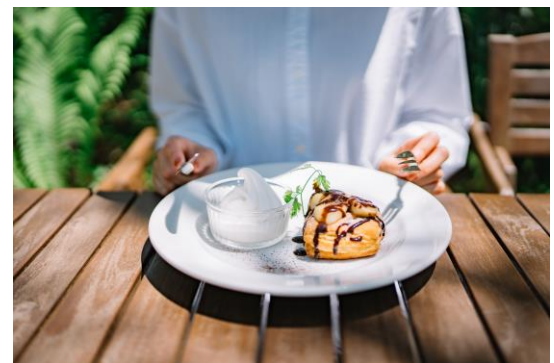
期間限定メニュー チョコバナナデニッシュ