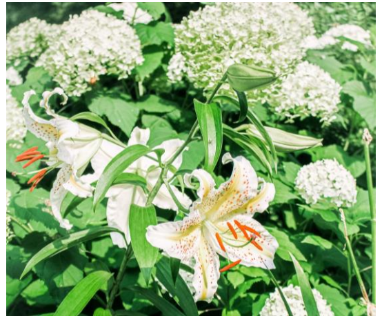
手前:ヤマユリ 奥:アナベル