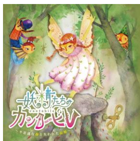
『妖精たちのカンタービレ』メインビジュアル