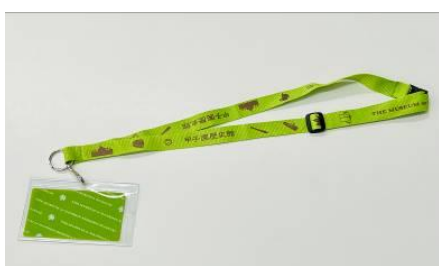
(オリジナルチケットホルダー)