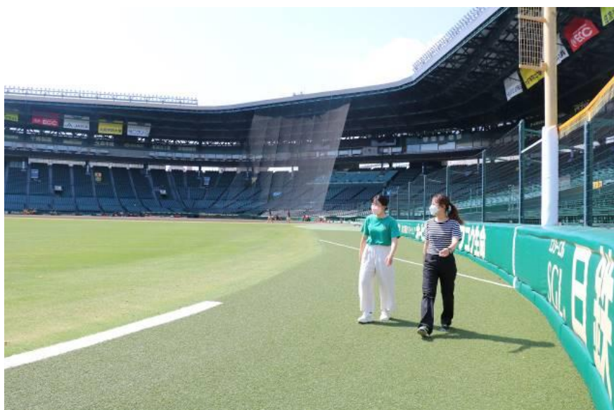
上：外野ウォーニングゾーン見学のイメージ