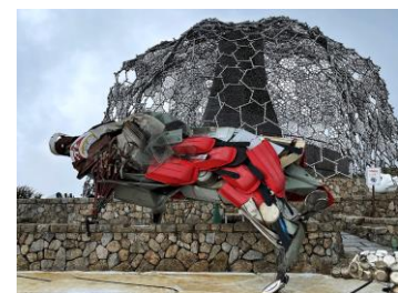
淀川テクニク 《六甲山ムツコ グリボウ グリグリボウ》

アーティスト名：淀川テクニク（よどがわてくにつく） 作品名：六甲山ムツコ グリボウ グリグリボウ （ろっこうさんむつこ ぐりぼう ぐりぐりぼう） 展示会場名：六甲ガーデンテラスエリア