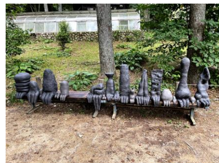
浅野暢晴《狭間の森》

(賞金10万円) 提供：株式会社有馬ビューホテル アーティスト名：浅野暢晴 (あさののぶはる) 作品名：狭間の森 (はざまのもり) 展示会場名：六甲高山植物園