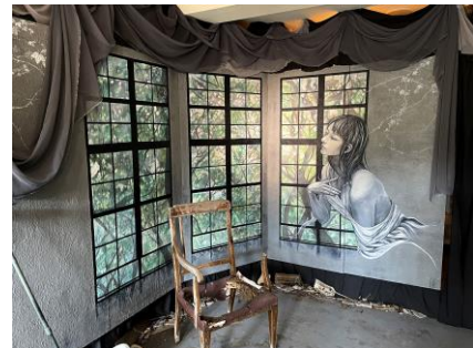
はやしだちか《光注ぐ廃墟》

(賞金10万円) 提供：六甲山観光株式会社 (南洋真珠ペンダント) 提供：有限会社イソワインターナショナル アーティスト名：はやしだちか (はやしだちか) 作品名：光注ぐ廃墟 (ひかりそそぐはいきょ) 展示会場名：六甲山芸術センター