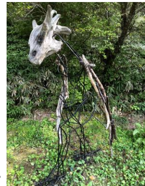
伊藤大寛《ナイトミュージアム》

アーティスト名：伊藤大寛（いとうたいかん） 作品名：ナイトミュージアム（ないとみゅーじあむ） 展示会場名：ROKKO 森の音ミュージアム