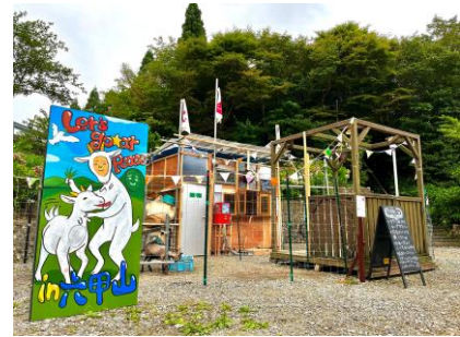
にしかわしょう子 《Let's go★at Peace》

アーティスト名：にしかわしょう子（にしかわしょうこ） 作品名：Let's go★at Peace（れっつ ごー あっと ぴーす） 展示会場名：六甲ガーデンテラスエリア