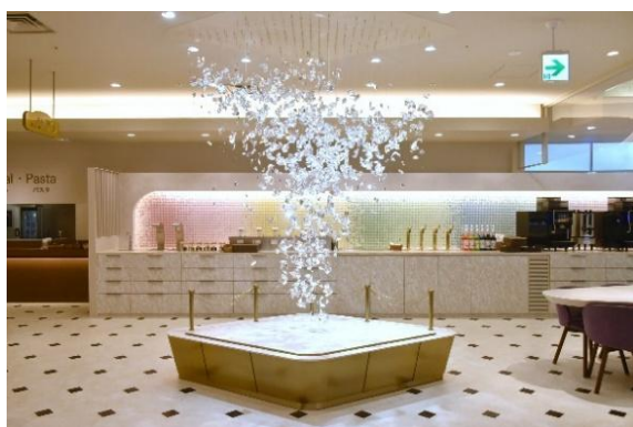
光のアートワーク