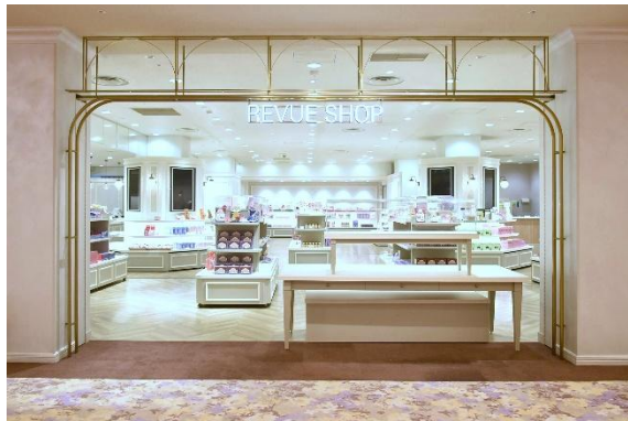
レビューショップ 外観