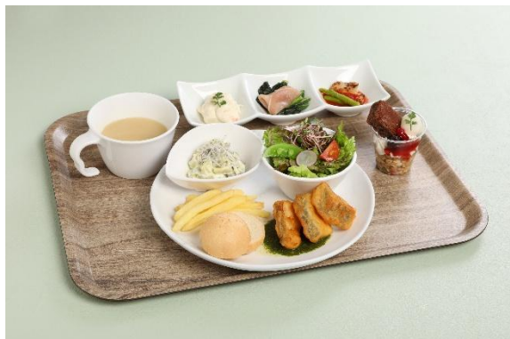
①レビュープレート

今回のリニューアルにあたり、公演や季節にちなんだプレートを中心にメニューを一新。 5組のシンボルカラーをイメージしたデザインが印象的な全長9mのドリンクバーでは、コーヒーやフレーバーティーなどのソフトドリンクの他、フランス産のシロップとソーダ水などを自由に組み合わせて作るアレンジドリンクなど、20種類以上のラインナップから、好みの飲み物をお好きなだけお楽しみいただけます。