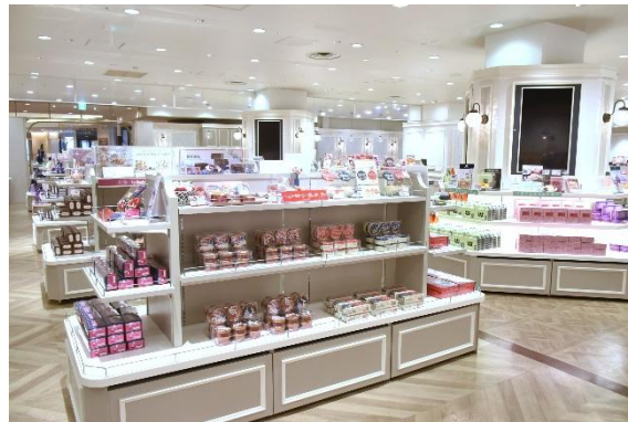
レビューショップ 店内

また、先行して移転オープンしております次の店舗につきましても、このほどファサード（外観）を整備し、ご利用をお待ちいたしております。