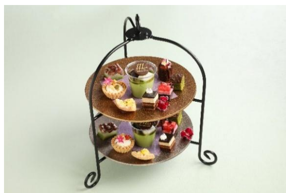
④アフタヌーンティセット