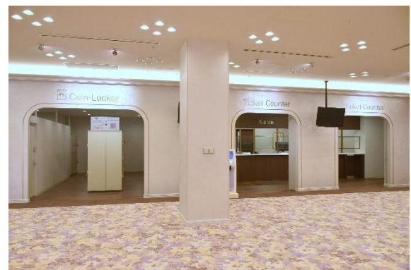
コインロッカー・チケットカウンター