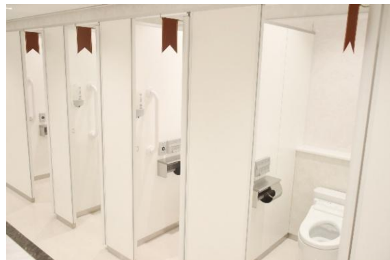
劇場改札内1階女性用トイレ2