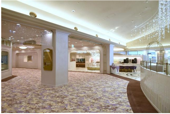
建物エントランス