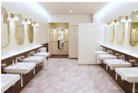
館内女性用トイレ

トイレのリニューアルにあたっては、オストメイト対応の多機能トイレを整備し、バリアフリー機能を充実させるほか、男性用・女性用の各トイレにベビーチェアやベビーベッドを設置するなど、お客様に安心してお使いいただけるようにいたしました。また、劇場改札外のコインロッカーは台数とサイズを増やしたうえでチケットカウンター横に集約し、ロビー（大広間）にはソファ席を増設するなど、利便性や機能性にもこだわりました。