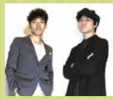
ギターボーカルユニット Roots Dawn