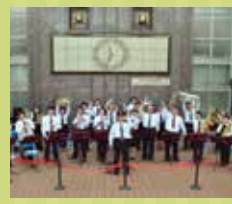
阪急電鉄吹奏楽団