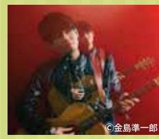
シンガーソングライター 金島準一郎