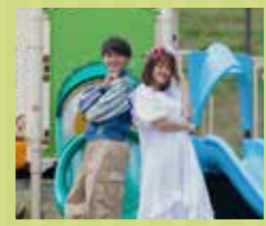
鉄道系音楽グループ 半熟 BLOOD