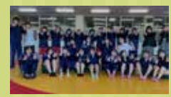
兵庫県立 猪名川高校ダンス部